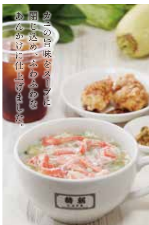
Crab Sauce Rice Porridge / 蟹醬粥