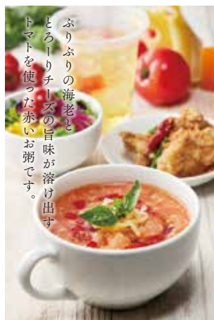
Shrimp and Cheese and Tomato Rice Porridge / 虾和奶酪和番茄粥